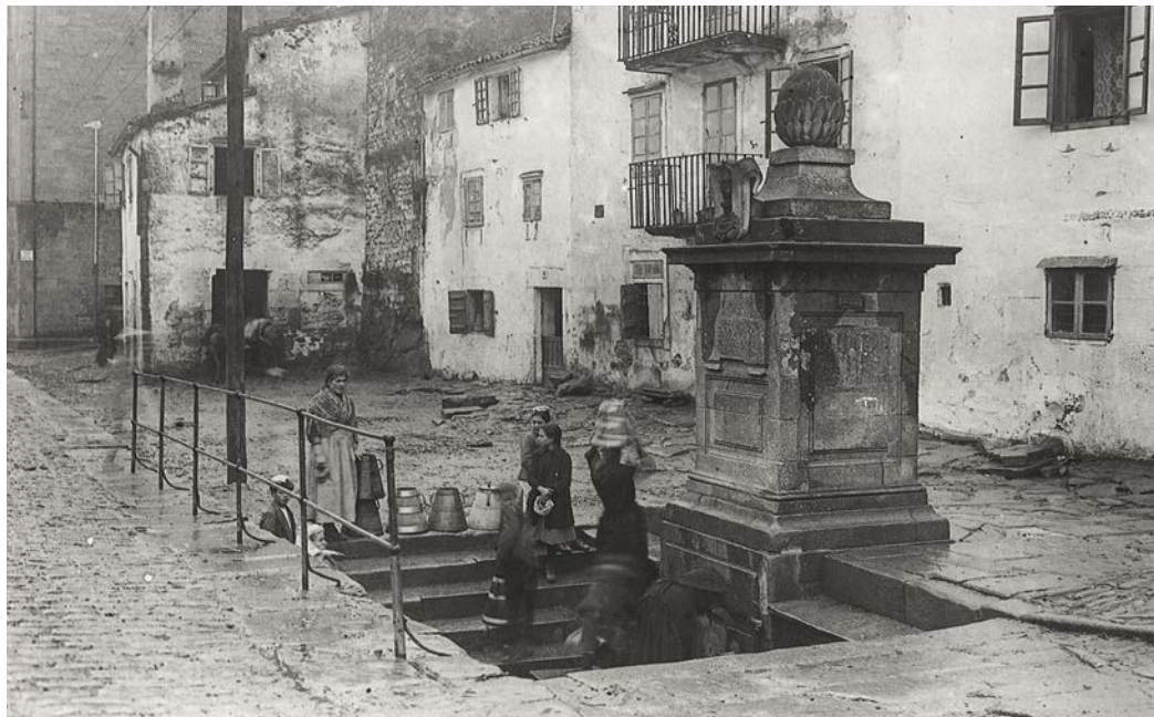
1. Fonte da Porta do Camiño ~ P. Mas , 1919