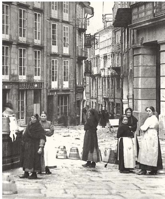
2. Fonte de Cervantes ~ P. Mas, 1919