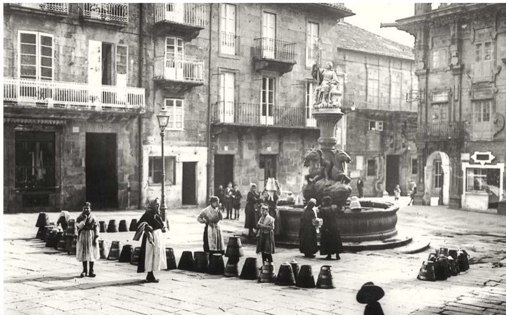
3. Fonte das Praterías ~ P. Mas, 1919