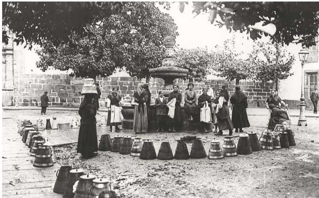
4. Fonte de Mazarelos ~ P. Mas, 1919