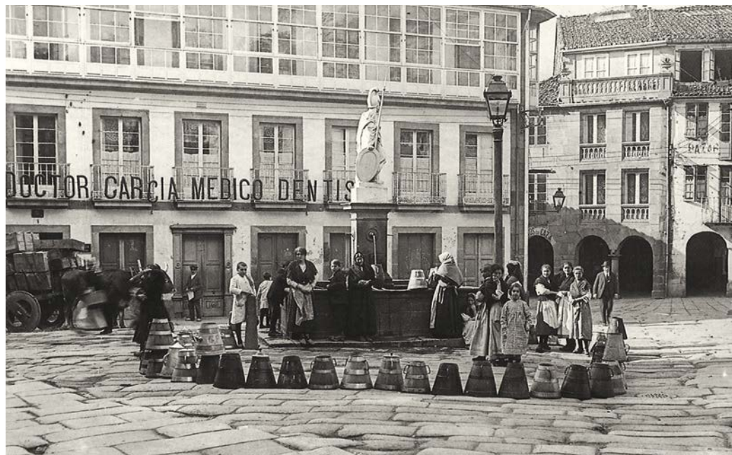
5. Fonte do Toural ~ P. Mas, 1919