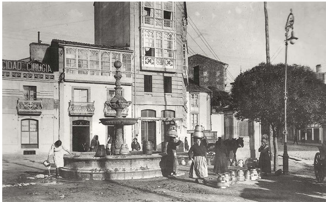
Elas sempre co traballo na cabeza