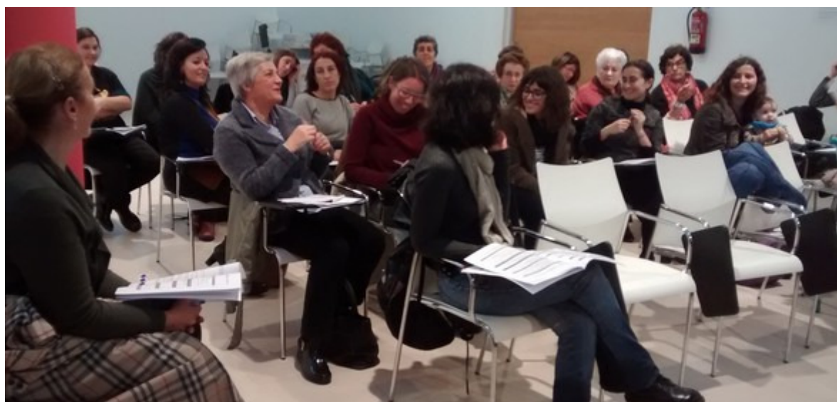
Momento de presentación do Encontro de Mulleres.