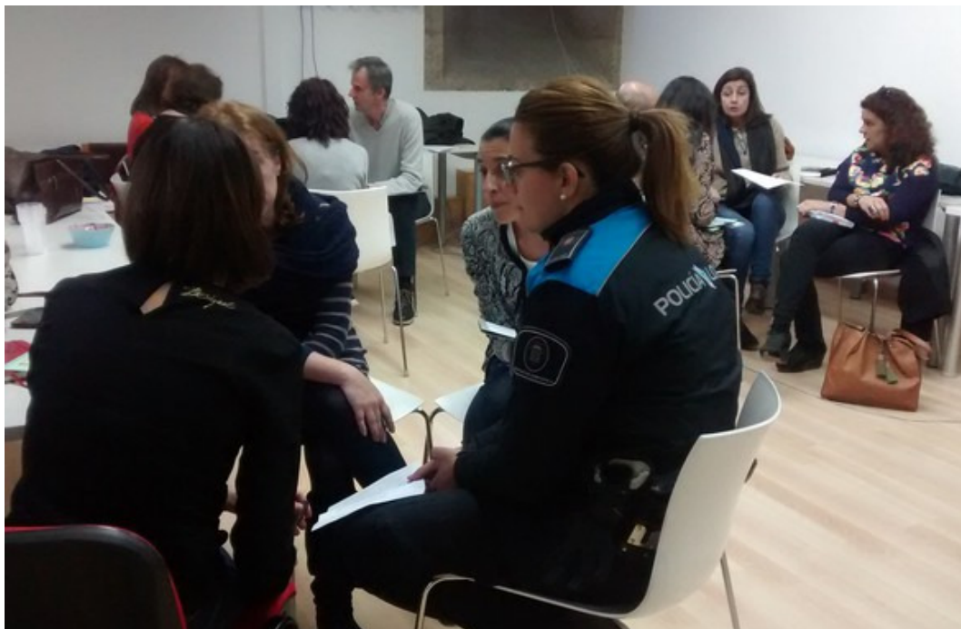
Mesa de administración local en Raxoi.