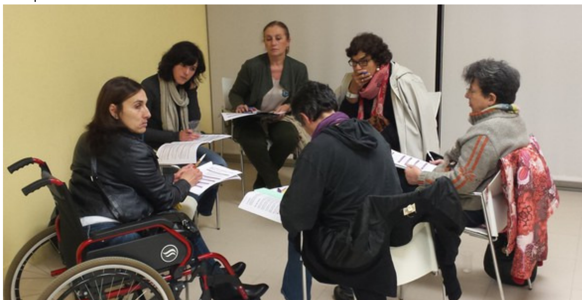
Participantes no Encontro