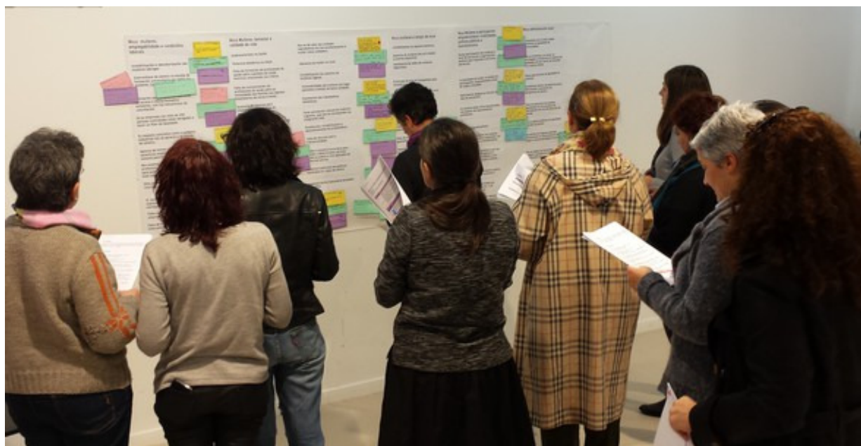
Participantes no Encontro. Momento de priorización de problemas