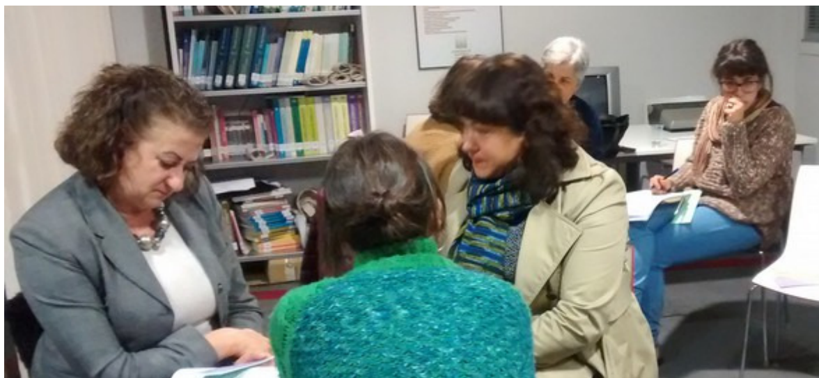
Momento de traballo grupal da Mesa de emprego