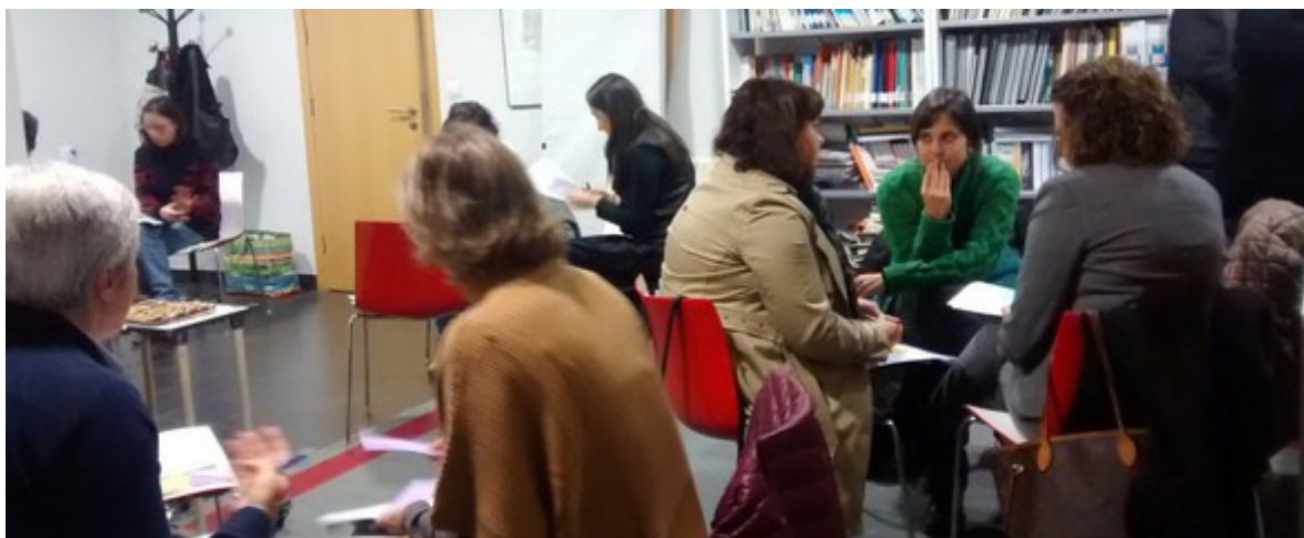
Mesa de Mulleres, emprego e relacións laborais.

O obxectivo foi o de recoller e integrar no desenvolvemento global deste proxecto as súas experiencias, consideracións e melloras como un activo central para a reflexión e o contraste de propostas de actuación.