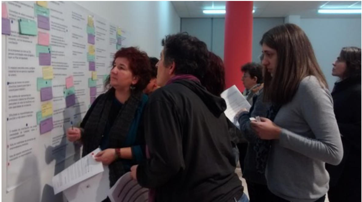
Panel de priorización de problemas