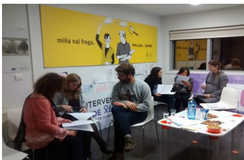
Mesa mulleres e participación: empoderamento, visibilidades, políticas públicas e asociacionismo