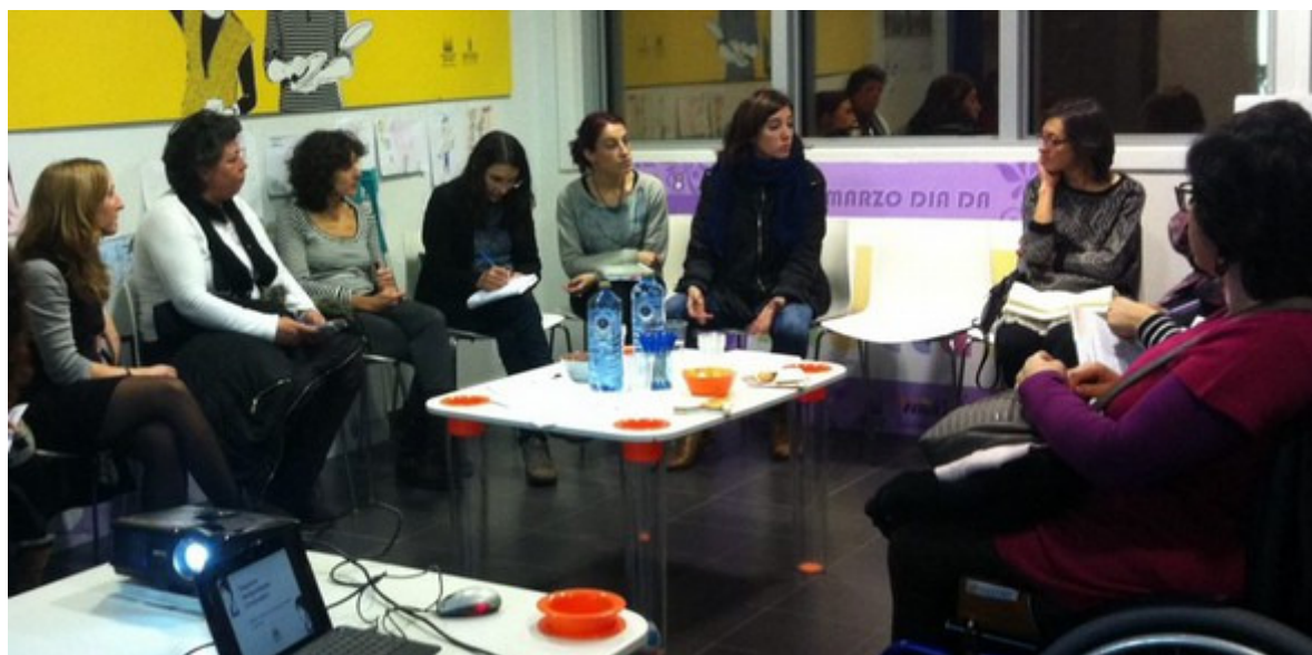
Mesa mulleres e participación: empoderamento, visibilidades, políticas públicas e asociacionismo