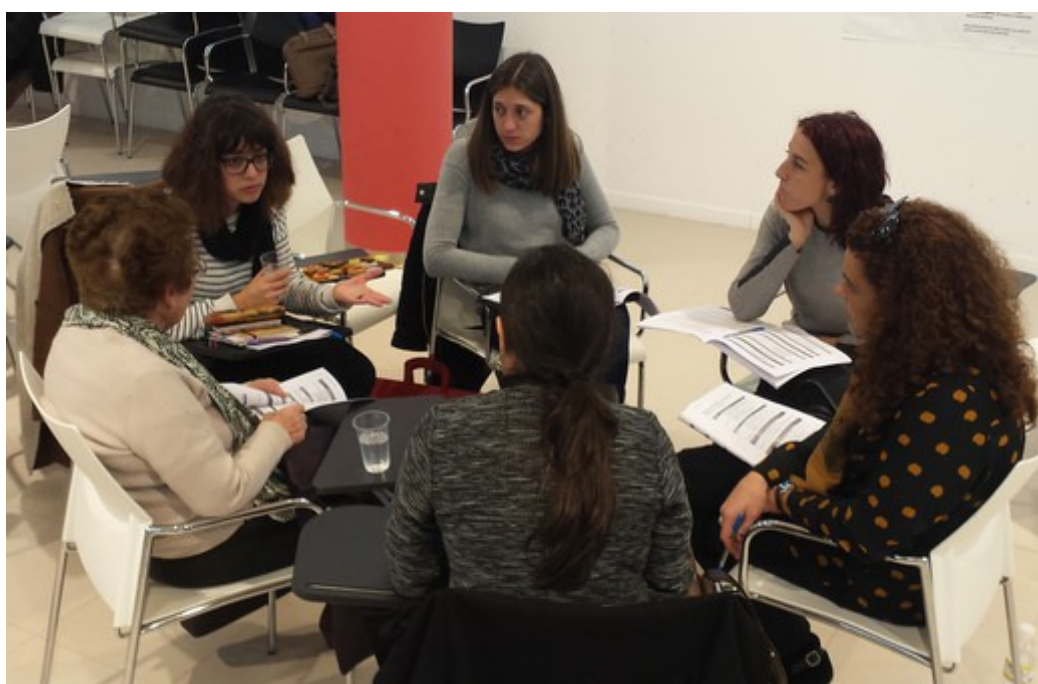
Espazo de traballo grupal no Encontro.

Inclúese unha matización ao problema identificando co mantemento de desigualdades no ámbito da cultural da música e baile tradicional, ampliándoo a calquera tipo manifestación.