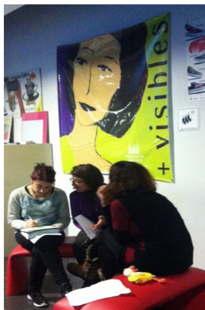
Mesa de Mulleres, benestar e calidade de vida. Grupo de traballo