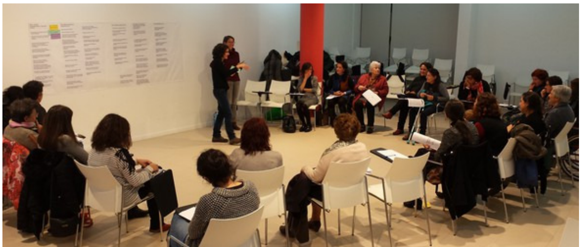
Momento de posta en común do traballo.