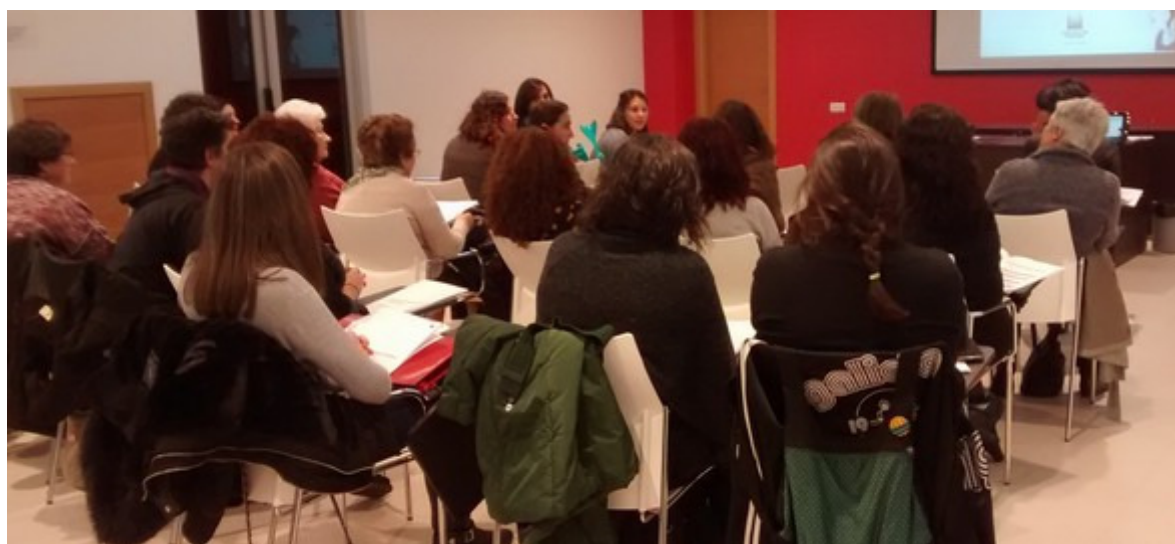
Momento de presentación do Encontro. Casa das Asociacións de Benestar (CABES)